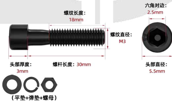
图 7 安装螺栓各部件尺寸