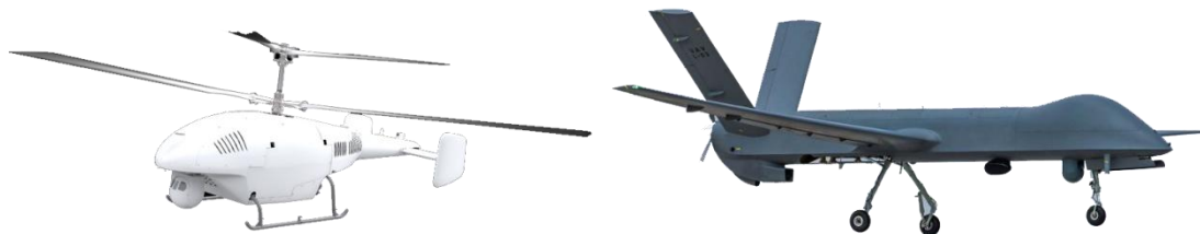
图 2 大型无人机