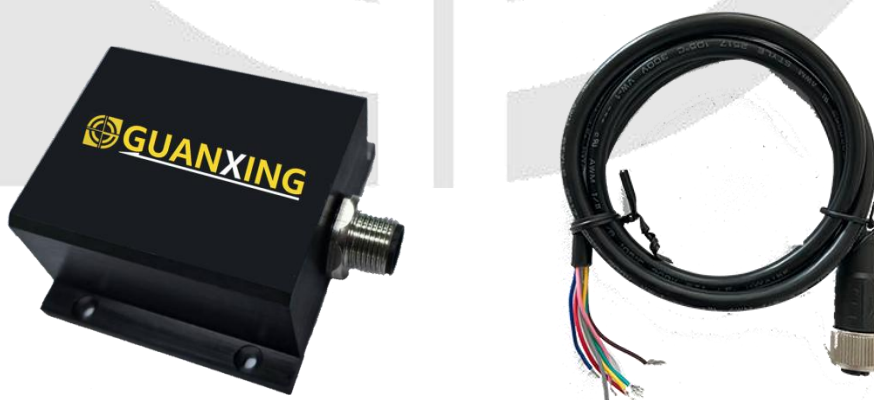
图 5 传感器主体与通信电缆