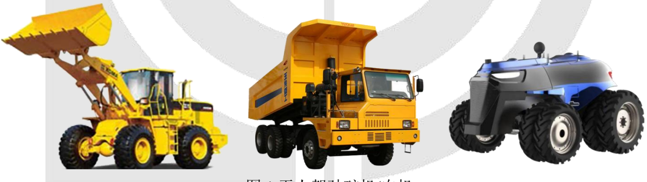
图 1 无人驾驶矿机/农机

由于矿区和农田环境恶劣，司机从业意愿低，招工难、管理难，人工费高，而且矿机/农车型大、盲区多，操作复杂，因而司机作业易疲劳，常发生安全生产事故。近年来无人驾驶的矿机/农机逐渐成为主流。运动姿态传感器能够描述机械运动的空间姿态，为无人驾驶矿机/农机提供稳定的位置、速度和姿态信息，与 RTK 技术（实时动态定位技术）结合，可以将定位精度从米级提升到厘米级，显著提升了无人驾驶矿机/农机的导航精准性。