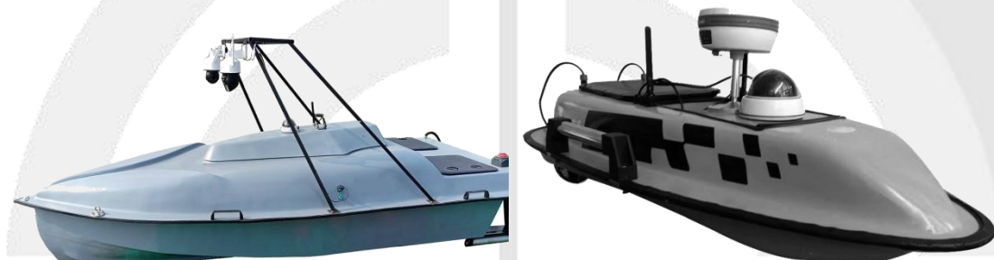
图 3 无人船舶

无人船是一种可以无需遥控，借助精确卫星定位和自身传感即可按照预设任务在水面航行的全自动水面机器人，英文缩写为 USV。无人船广泛用于水文水质监测、河流海洋测绘、水面搜救、水体清洁等方面。运动姿态传感器可实时监测无人船舶的航行姿态，作为其重要的传感器之一。