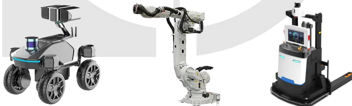
图 4 大型机器人

目前机器人在很多领域已经完成了人类不能参与的工作，比如在恶劣的环境，大载重、重复性工作以及人类不能到达的狭窄区域和危险的工作等。运动姿态传感器可以用来监测机器人的平衡、力臂运行等运动姿态，从而通过控制系统调节其运动；与其它导航方式形成组合导航系统，保障导航的连续性与稳定性。